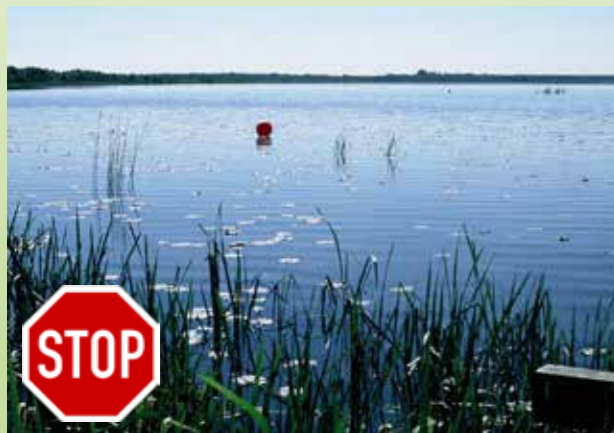
Rote Bojen-Ketten kennzeichnen die wasserseitige Grenze des Naturschutzgebietes