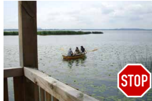
Schwimmblattbestände stehen überall unter Naturschutz. Das Hineinfahren ist verboten!