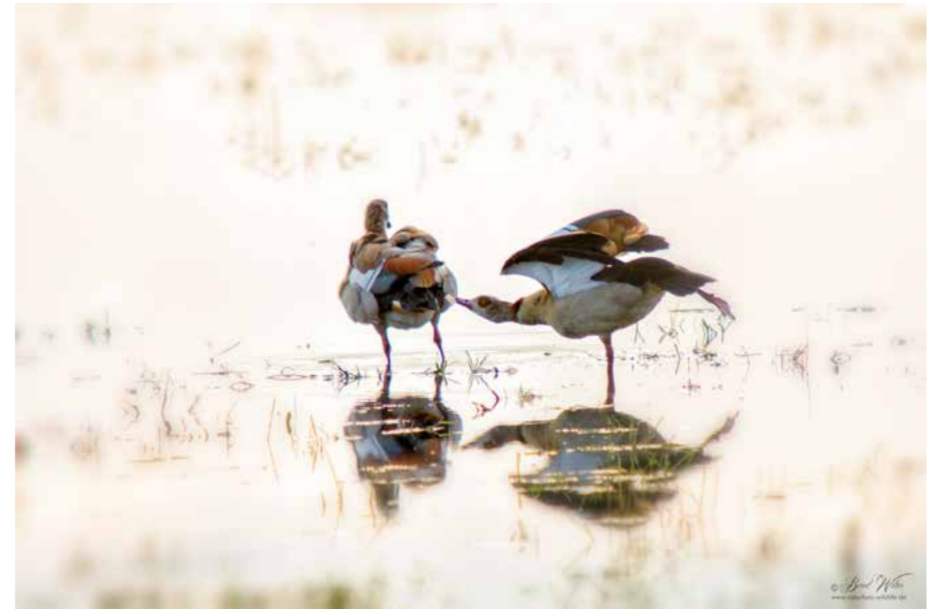
Bernd Wolter: Nilgänse

Anlässlich des 40. Jubiläums des Naturparks Steinhuder Meer zeigen sie ihre schönsten Aufnahmen auch vom 1. bis 23. November 2014 unter dem Titel „Naturerlebnis Steinhuder Meer“ in der denkmalgeschützten Kunstscheune im Scheunenviertel, Meerstraße 9, 31515 Wunstorf-Steinhude.