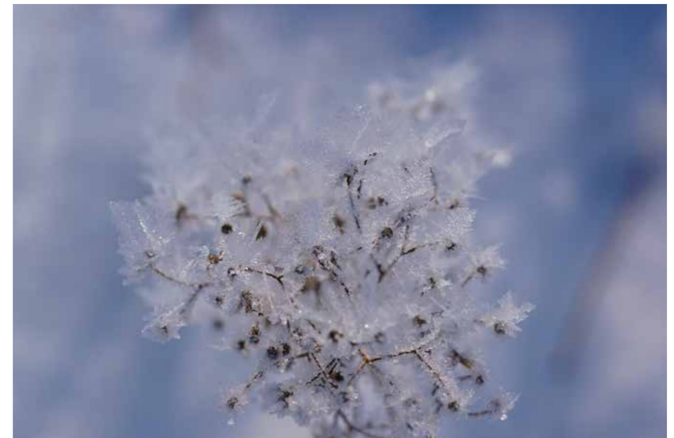
Telke Nieter: Kristallbäume