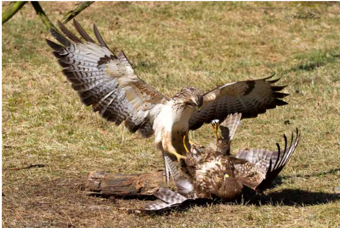
Wilfried Rave: Zankende Bussarde