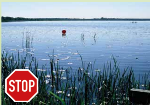
Bojen-Ketten kennzeichnen die wasserseitige Grenze des Naturschutzgebietes